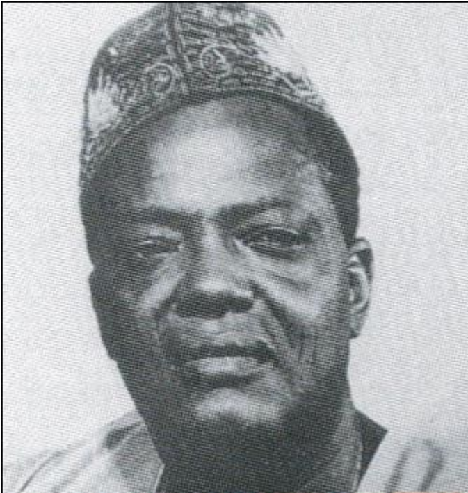
M. Hubert MAGA 1er Président 01/08/1960 - 27/10/1963 07/05/1970 - 07/05/1972