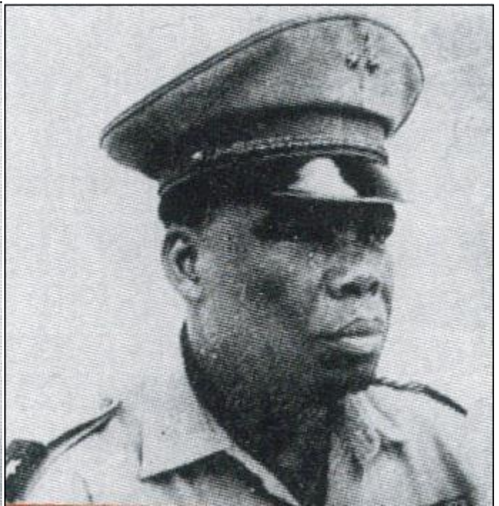
Gal. Christophe SOGLO 28/10/1963 - 25/01/1964 22/12/1965 - 17/12/1967