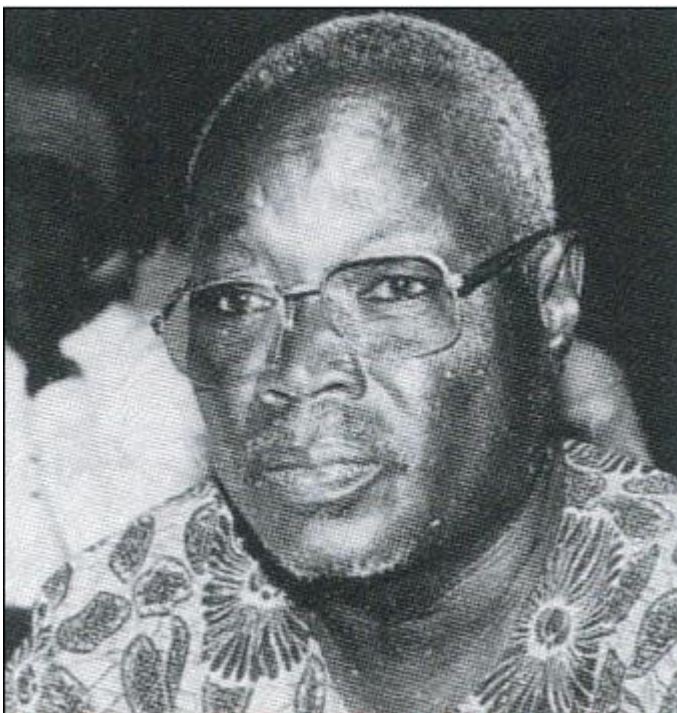
Col. Maurice I. KOUANDETE 20/12/1967 - 21/12/1967 10/12/1969 - 13/12/1969