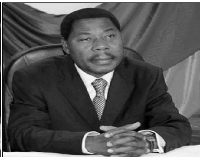
Dr Thomas Yayi BONI, actuel président 06/04/2006 -

Ancienne colonie française devenue indépendante en 1960 sous le nom de République du Dahomey, elle connaît une série de coups d'État militaires qui lui donnent la réputation de pays le plus instable de l'Afrique.