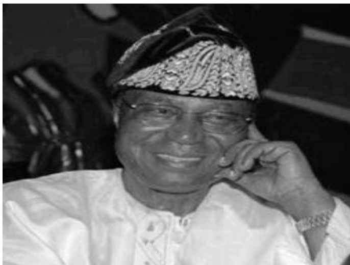
Nicéphore D. SOGLO 04/04/1991 - 04/04/1996