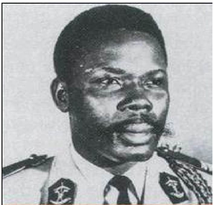
Col. Alphonse A. ALLEY 22/12/1967 - 17/07/1968