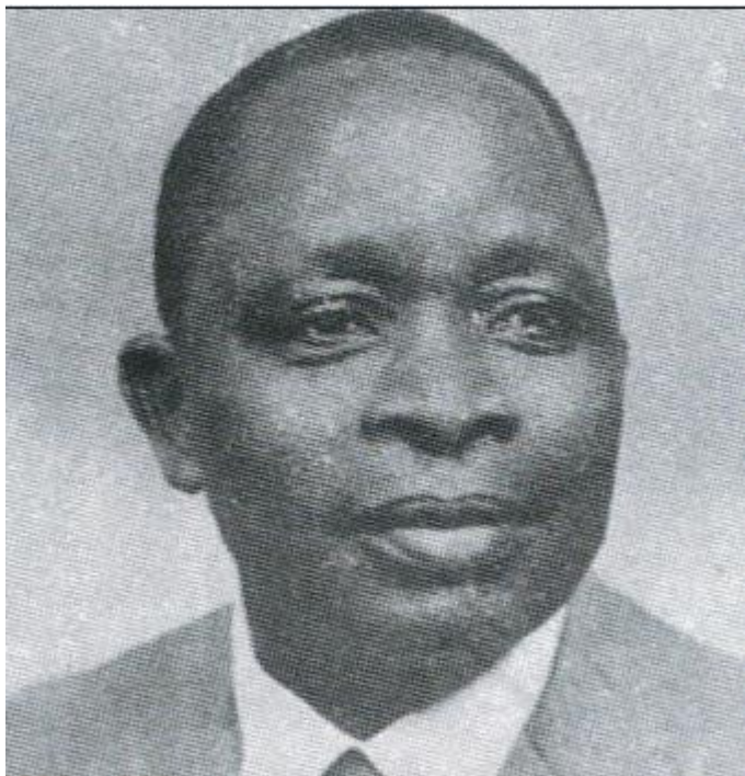
M. Tahirou CONGACOU 29/11/1965 - 22/12/1965