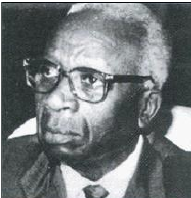
M. Emile D. ZINSOU 17/07/1968 - 10/12/1969